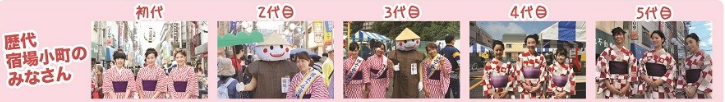
横浜市保土ヶ谷区役所『統計で知るほどがや へそ』より抜粋 (一部改変)

平成天皇陛下退位 仏ルノー、ゴーン会長「解任」 日トタクル騒動 ノートダム大騒動 北海道胆振東部地震が起きる トランプ大統領就任 藤井4段、29連勝 ブレミアムフライデー 森友・加計問題 ボケモンGO リオ五輪で41個メダル獲得 スマップ解散 熊本地震が起きる バリ同時多発テロ ファイデル・カストロ氏死去 佐野エンブレム騒動 戦後70年を迎える 妖怪ウォッチが大流行 消費税が8%に アナ雪嵐 ホストンマラソン爆弾テロ 「倍返し」が流行語 あまちゃんブーム 富士山が世界遺産に登録される バク・クン韓国初女性大統領誕生 金正恩第一書記誕生 「IPS細胞」でノーベル賞 東京スカイツリー完成 スタイーブ・ジョブズ氏死去 アラブの春 なでしこジャパンがW杯優勝 東日本大震災が起きる J A L 経営破綻 朝青龍が引退 ハイチ大地震、22万人死去 「食べるラー油」が空前のブーム マイケルジャクソン死去 オハマ大統領就任 第2回WBCで日本が2大会連続優勝 裁判員制度スタート 四大地震 M8.0 アメリカ発の世界金融危機広がる 日本人4名ノベル賞 秋葉原無差別殺傷事件 東国原英夫が宮崎県知事に当選 任天堂の新型ゲーム機Wiiがヒット 消えた年金 第1回WBC 荒川静香イナバウアー ライブドア事件 ハンカチ王子vsマー君